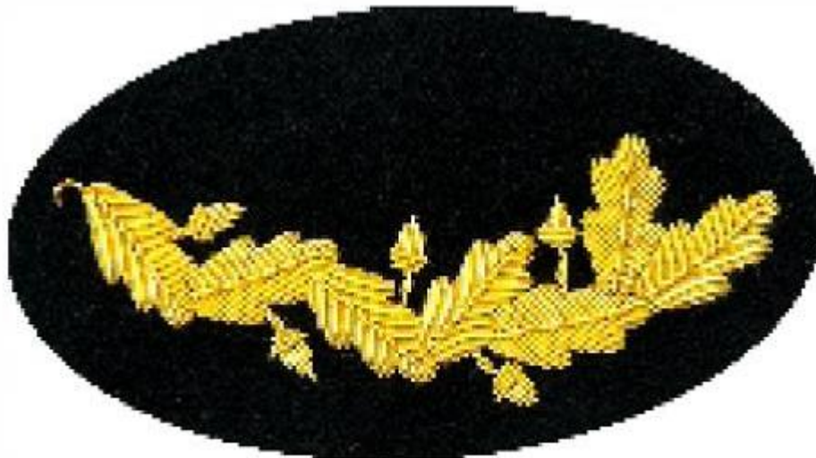
Figura 1. Alamar dorado derecho

Las cajas de cartón deben ser rotuladas mínimo por una de las caras laterales con código de barras de acuerdo al boletín SILOG No. 5 actualizado.