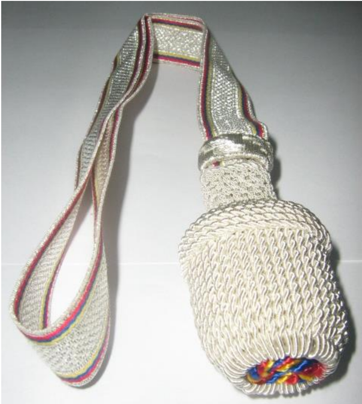
Figura 1. Dragóna para espada